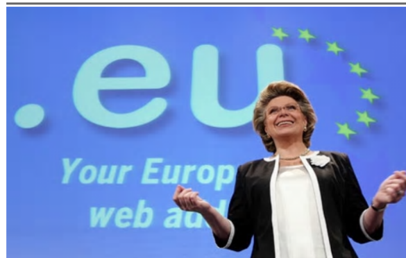
EU commissioner Viviane Reding